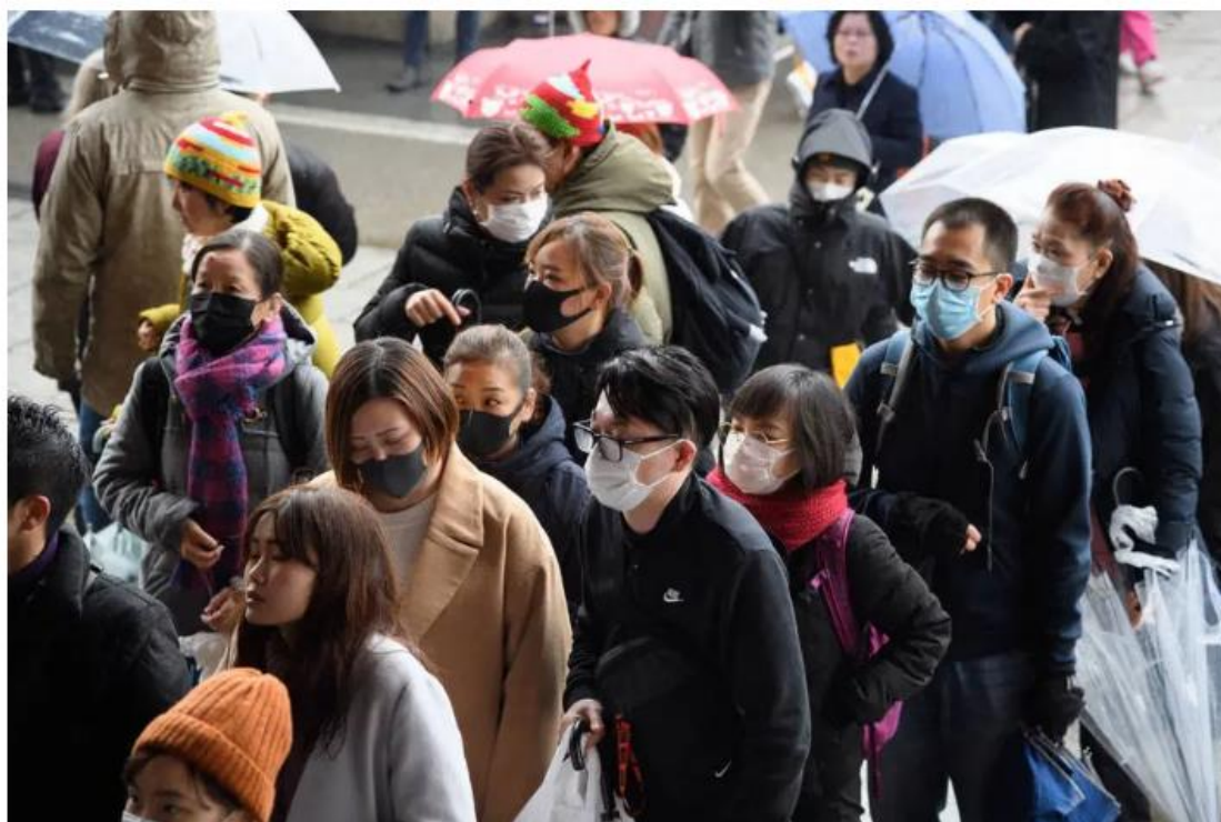
Maioria dos turistas que chegam ao Japão são chineses.

RIO - Só onze dias após a identificação de um novo coronavírus na China , cientistas de ao menos três laboratórios nos Estados Unidos e um na Austrália já buscavam uma vacina capaz de deter o acelerado avanço do surto. O conhecimento acumulado sobre a Síndrome Respiratória Aguda Grave (Sars), que matou cerca de 800 pessoas entre 2002 e 2003, a agilidade no sequenciamento genético do novo vírus e avanços tecnológicos na produção de imunizantes indicam cenário otimista. Um produto eficaz poderia ser obtido em prazo curto: um ano. Há uma década, essa velocidade seria impensável.